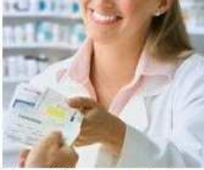
صيدلة. مباراة Pharmacie. Concours

صدر مؤخرًا كتاب مع قرص مدمج (DVD) لتهيئ مباراة ولوج دراسات الصيدلة، يضم نماذج من المباريات مع شرح مقررات السلك الأول جامعي، بيوكيمياء. الكتاب عربي-فرنسي (Arabe-Français)